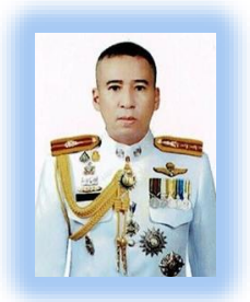
พ.ต.อ.นิติพันธุ์ โรหิตอปกการ รอง ผบก.ทพ.(๑)