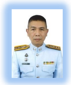
พ.ต.อ.ถาวร มีขำ รอง ผบก.ทพ.(๔)