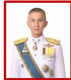
พลตำรวจตรี ปรีดา สถาวร รองผู้บัญชาการสำนักงานกำลังพล