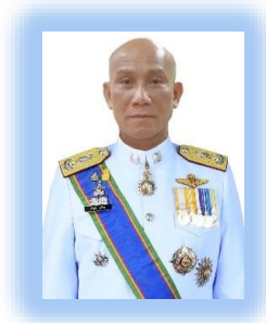
พล.ต.ต.บริสุทธิ์ นุศรีวอ ผบก.ทพ.