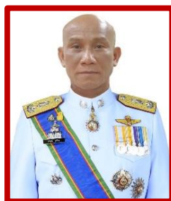
พล.ต.ต.บริสุทธิ์ นุศรีวอ ผู้บังคับการกองทะเบียนพล