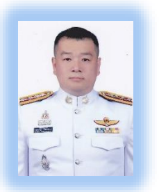
พ.ต.อ.ประเสริฐ วิจิตรทัศนารอง รอง ผบก.ทพ.(๒)